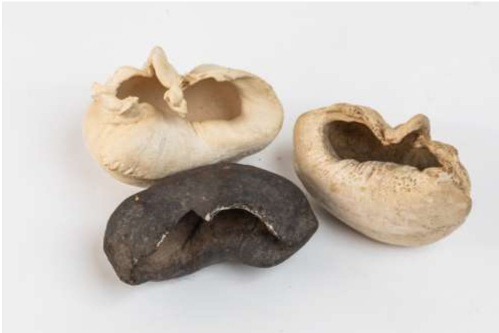
Trois osselets de l'oreille interne de baleine. de Floride aux USA et de Salles en France, objets curieux, pléistocène 220/300 € - Lot 248