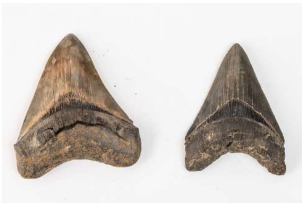
Deux dents de requin de carcharodon 250/350 € - Lot 249