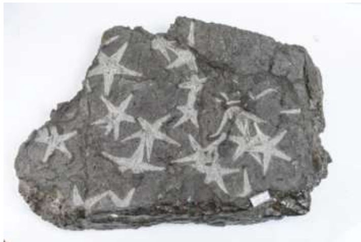
Etoile de mer : Astropecten martis

FOSSILES - COQUILLAGES- PREHISTOIRE ET MINÉRAUX